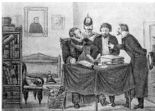
У квартального. Литография 1857 г.

внутренних дел и дореволюционной. И возможно этого просто не следует делать. Поэтому есть резон просто представить тех полицейских чинов, которые на протяжении многих лет олицетворяли благочиние и покой в городах и поселках России.