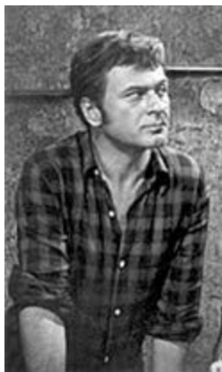
О. Бендер № 2 советского кино