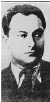
Е. Петров автор «12 стульев»