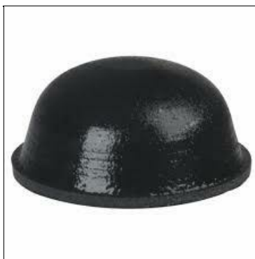
Бот Джоре «Догон-3». Диаметр — десять метров.

Наконец, зелёная линия упёрлась в огромные ворота, которые медленно открылись. Я застыл, увидев огромное помещение, в котором стояли полусфера черного цвета, «летающая тарелка», как их рисовали наши уфологии, и цилиндр со сферическими окончаниями.