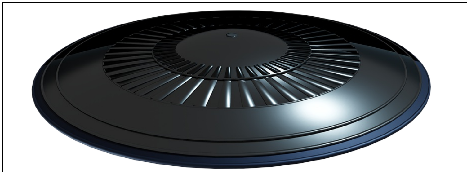
Грузовой челнок серии 075. Диаметр — двадцать метров.