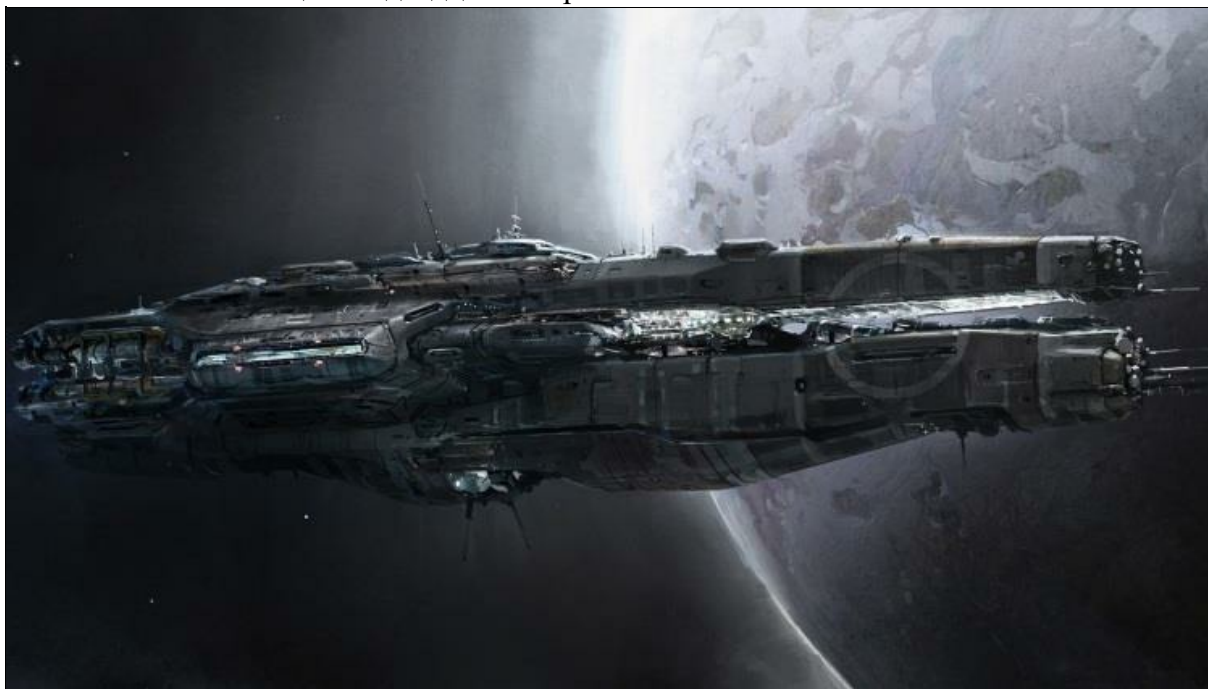
Линкор «Синяя планета».

Договор с республиканцами позволил получить деньги, которые мы потратили на покупку таких нужных вещей, как перерабатывающие сельскохозяйственные комплексы, завод по производству экспортной модели дроида, поставляемой в республику и её союзникам. Были произведены закупки металла, из которого мои искины, андроиды и дроиды на верфи собрали линкор «Синяя планета». Его длина была равна двум километрам, ширина — четыреста пятьдесят метров. Вооружён этот корабль был сотней самых мощных лазерных орудий, двумя сотнями ракет, зенитными многоствольными артиллерийскими установками ближней обороны. Против кораблей противника он мог применить с дистанции в два миллиона километров новые мощные ракеты с малыми прыгунам или четыреста миллиметровые болванки электромагнитных орудий, которых у него было шесть. Кроме этого на борту линкора имелаась малая авиация — двадцать истребителей.