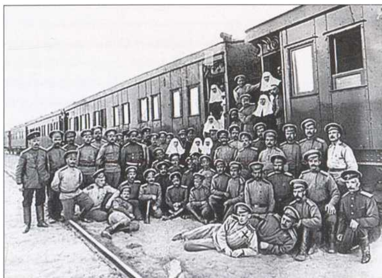
Есенин (на переднем плане, отмечен крестиком) среди персонала Полевого Царскосельского военно-санитарного поезда № 143. Черновцы. 7 июня 1916 г.