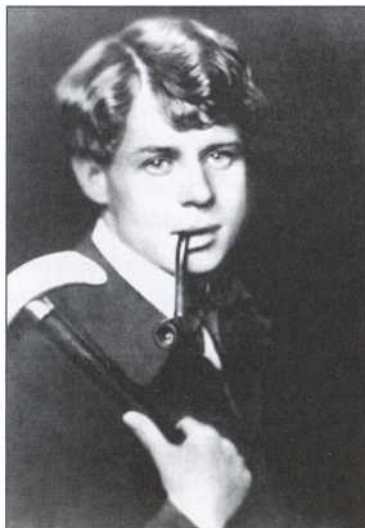
С. А. Есенин в 1917 г.