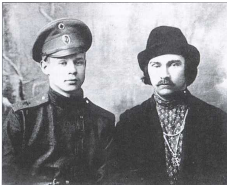
Поэты С. А. Есенин и Н.А. Клюев в Петрограде осенью 1916 г.