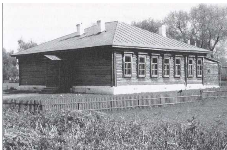
Школа, в которой учился С. А. Есенин в с. Константиново