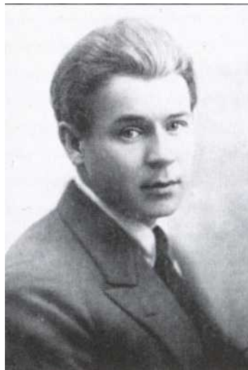
С. А. Есенин в последний год жизни