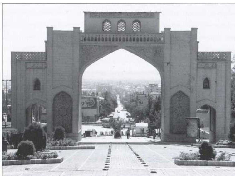
Шiraz. Современный вид