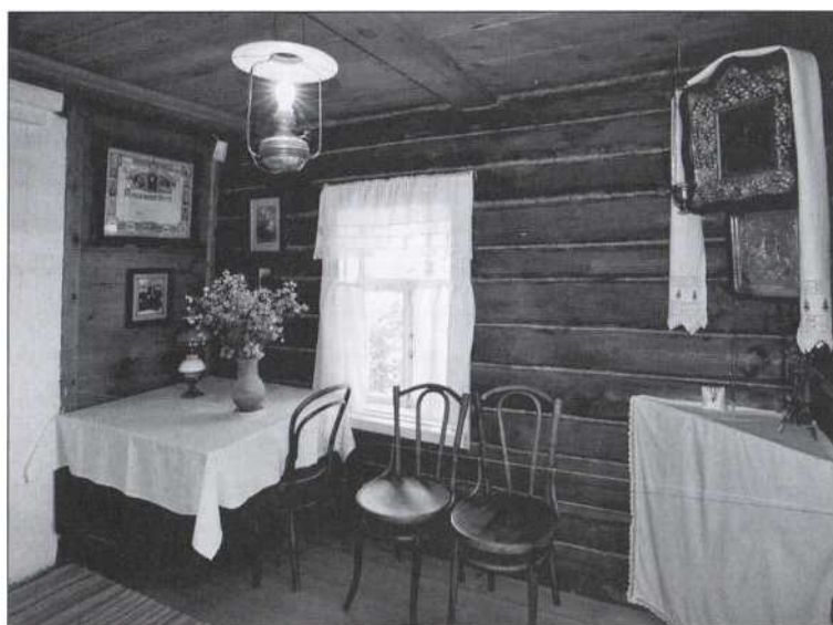
Интерьер Дома-музея С. А. Есенина