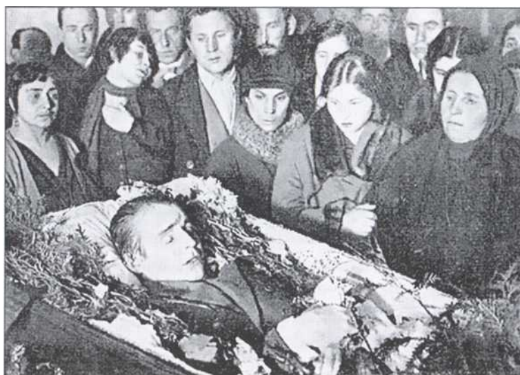
Похороны С. А. Есенина