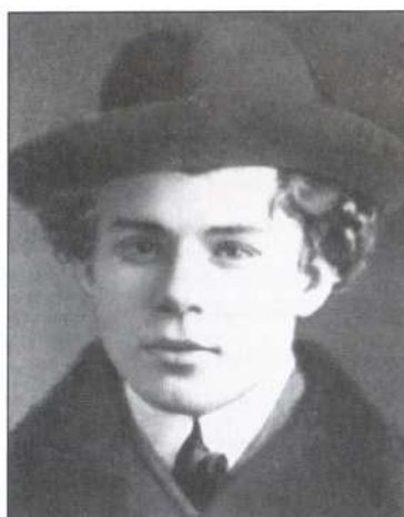
С. А. Есенин в 1913 г.