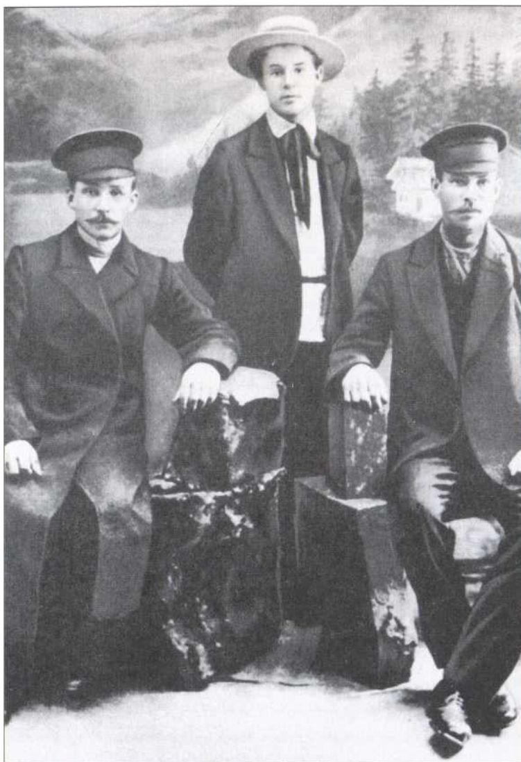
С. А. Есенин с отцом и дядей в 1912 г.