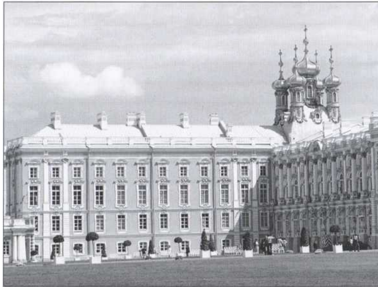
Большой Царскосельский дворец