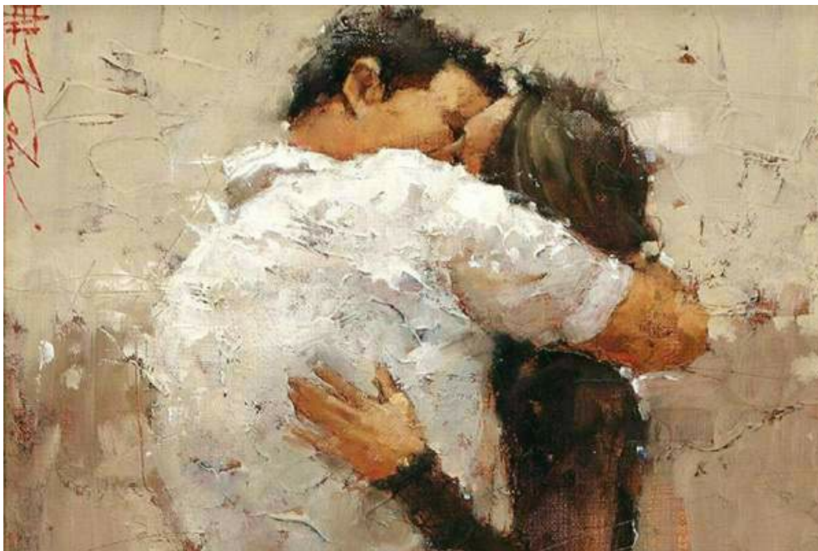
Картина художника Андре Кона ( Andre Kohn -)

Своего мужа я полюбила на семнадцатом году совместной жизни. Что самое смешное, в точности под Новый год. Получилось вроде как подарок.