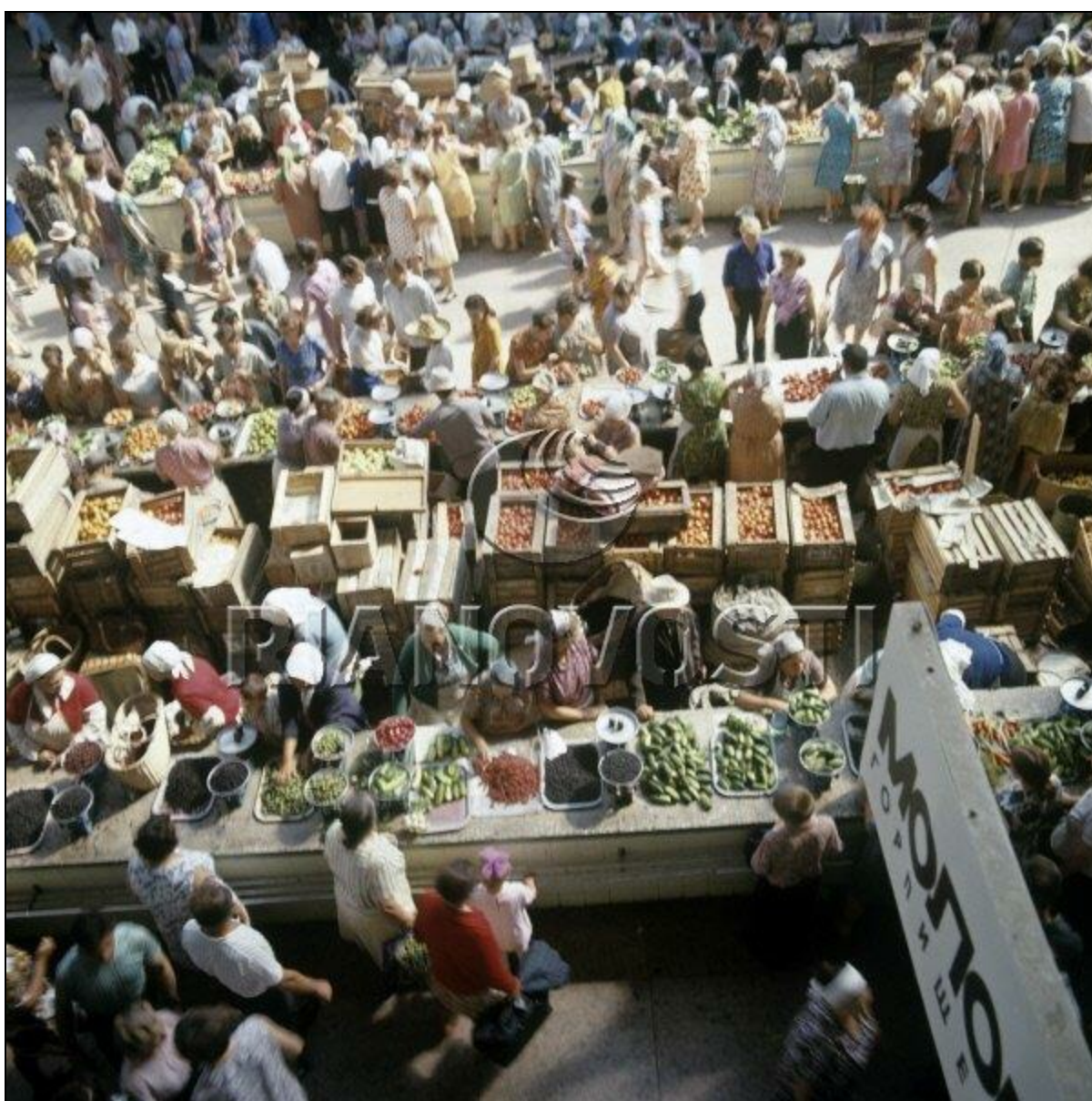
Колхозный рынок 1980 год (главный корпус)