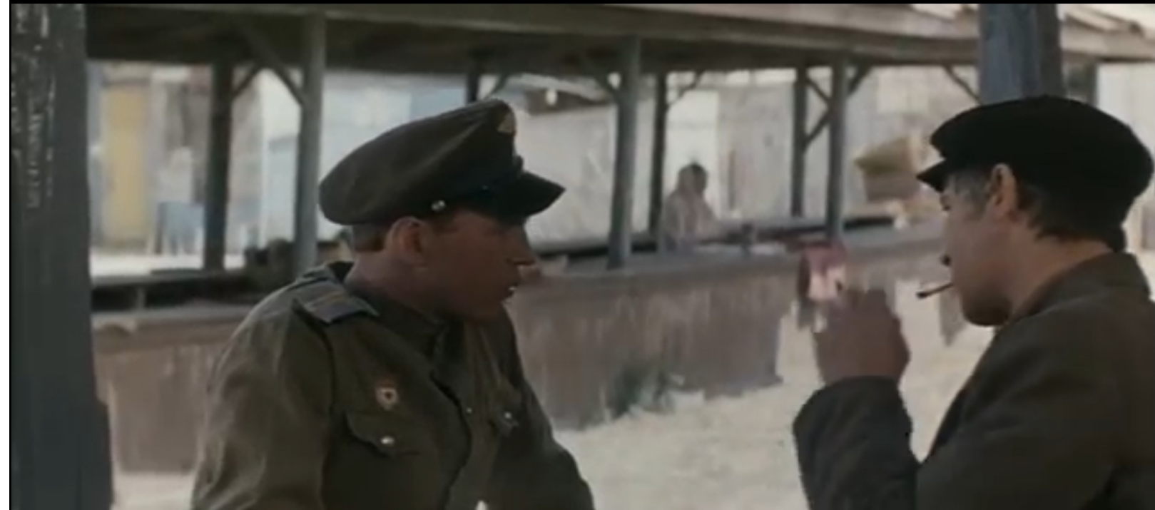
Колхозный рынок (открытый) кадры из фильма 1975 год